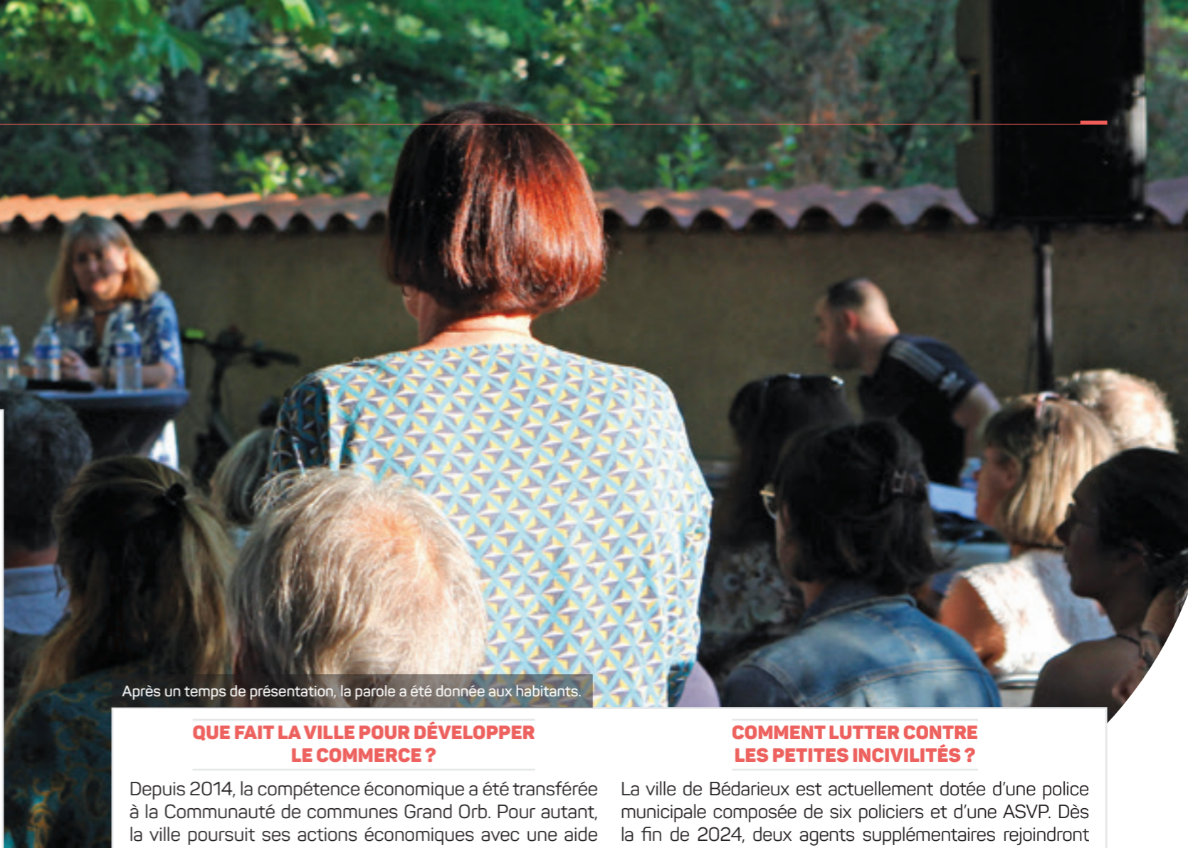
Après un temps de présentation, la parole a été donnée aux habitants.