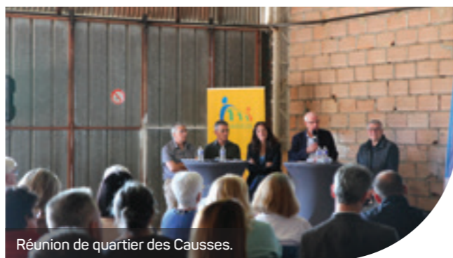
Réunion de quartier des Causses.

Depuis maintenant plusieurs années, la commune a dû repenser l'entretien de la ville au printemps avec l'entrée en vigueur de la réglementation « zéro phyto » interdisant l'utilisation des produits phytosanitaires. Dès lors, toutes les opérations de débroussaillage ou d'arrachage d'herbe doivent se faire mécaniquement. Il a donc été décidé d'effectuer des passages plus tardifs en raison des moyens humains consacrés à cette tâche, mais aussi pour une meilleure préservation de la biodiversité et des insectes.