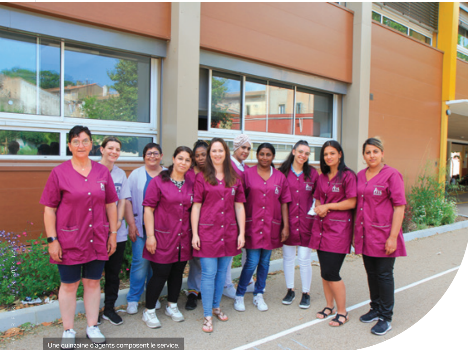
Une quinzaine d'agents composent le service.

Elles font partie des travailleurs dits « invisibles » dont la crise du Covid, toute récente, nous a rappelé l'importance. Le rôle de ces femmes est essentiel pour les agents, mais aussi les usagers de tout âge.